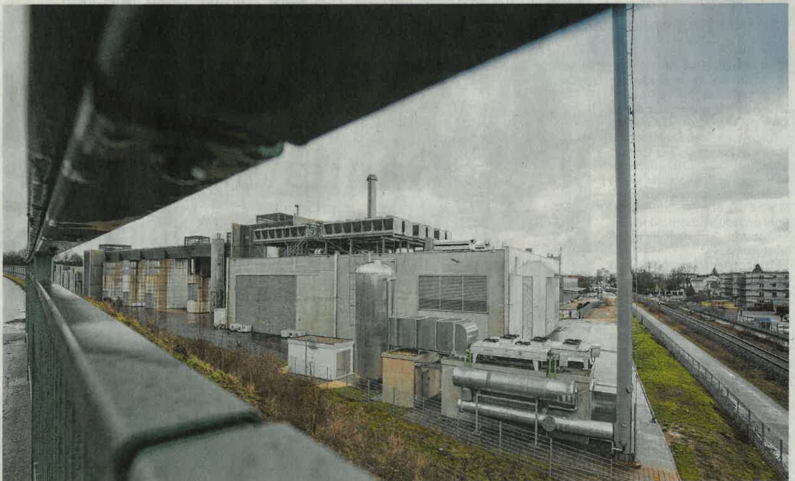
Wird teilweise demontiert und soll teilweise neu ausgerichtet werden: Das von den SWU erbaute Holzgas-Heizkraftwerk in Senden. Die Anlage gehört inzwischen der Firma Blue Energy.